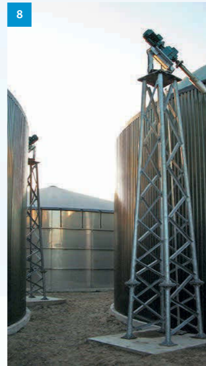
8 Außenstütze Langachsührwerk - Outside support for axial agitator - Venkovní stožár pro míchadlo na dlouhé hřídeli