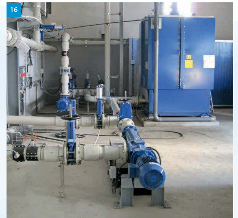
16 Hygienisierung - Sanitation unit - Hygienizace