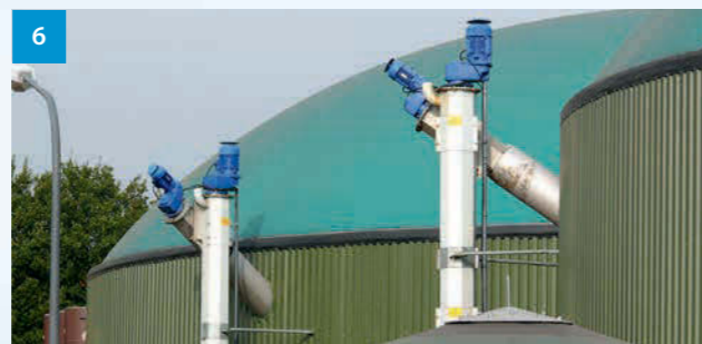
6 Stopfschnecken - Fermenter screw - Fermentorové šneky