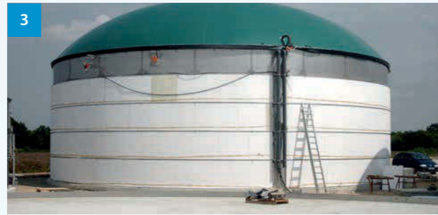
3 Anlage im Bau - Biogas plant under construction - Bioplynová stanice ve výstavbě