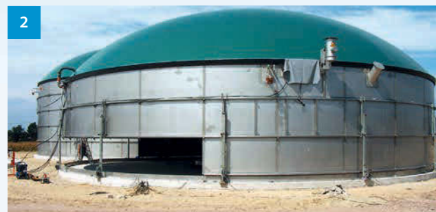
2 Anlage im Bau - Biogas plant under construction - Bioplynová stanice ve výstavbě