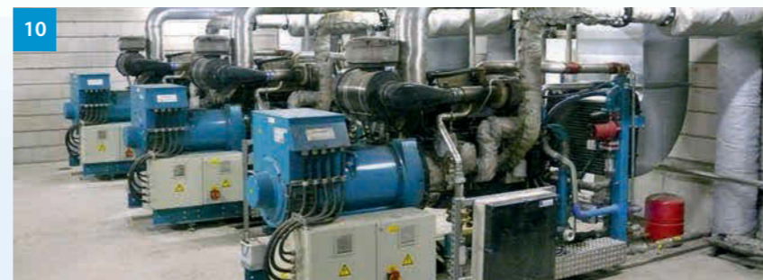
10 Blockheizkraftwerk im Gebäude - Combined heat and power unit (CHP) in a building - Kogenerační jednotky v budově