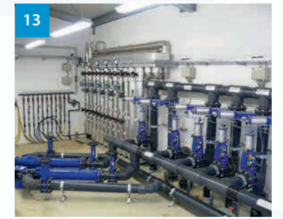
13 Pumpenblock - Pumping technology - Čerpač blok