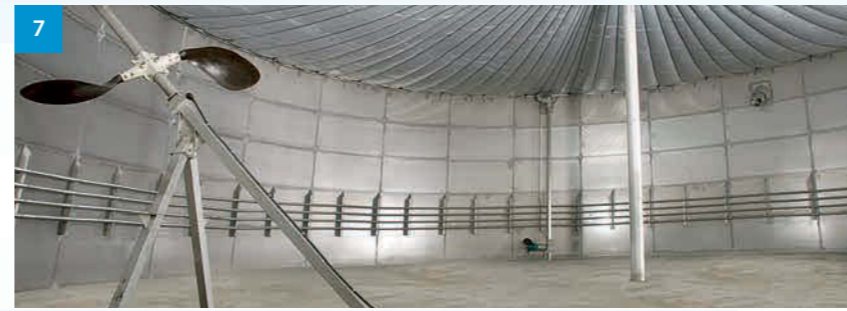
7 Fermenter Innensicht - Fermenter from inside - Pohled dovnitř fermentoru