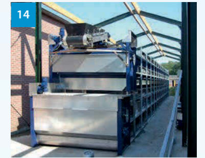
14 Trocknung - Drying unit - Sušení