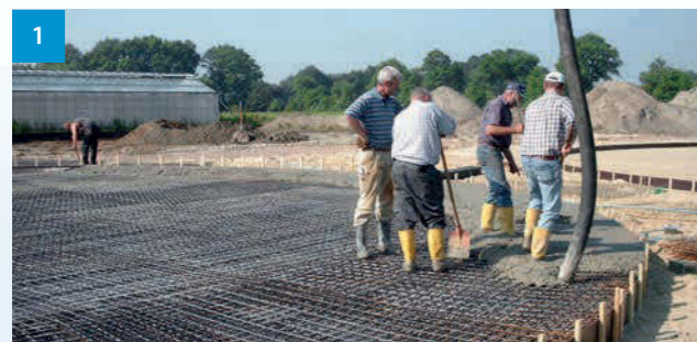
1 Erstellung der Bodenplatte - Fitting of the concrete base - Výstavba betonových základových desek