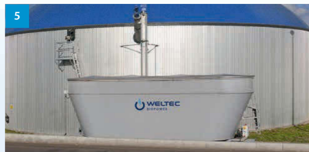
5 Vertikalosierer - Vertical dosificator - Dávkovač pevných substrátů