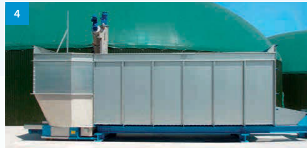
4 Feststoffeintrag Schubboden - Moving floor container - Dávkovač s posuvnou podlahou