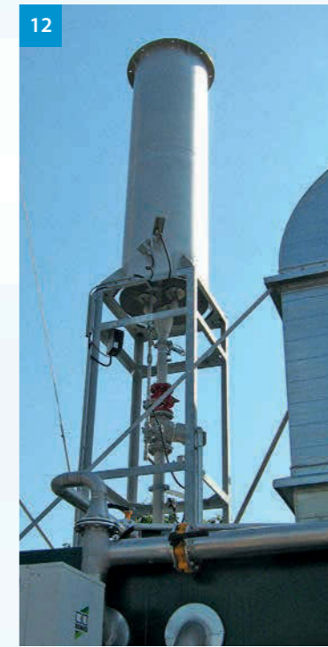
12 Biogassackel - Biogas flare - Nouzový hořák