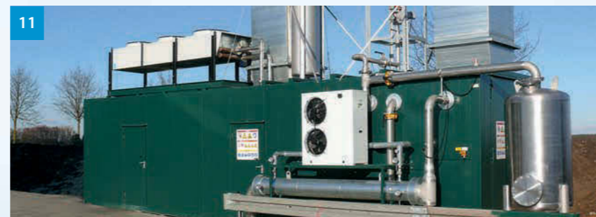
11 Blockheizkraftwerk im Container - CHP in a container - Kogenerační jednotka v kontejneru