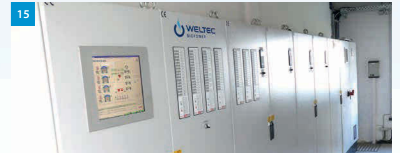
15 Schaltschrank/Visualisierung - Control/visualization - Řídicí rozvaděč/vizualizace